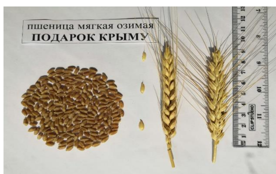
Рисунок 1 – Зерно и колос сорта озимой мягкой пшеницы Подарок Крыму, 2019 г.

Сорт получен методом межсортовой гибридизации и индивидуального отбора из гибридной комбинации Suwon 219 × Ксения. Скрещивание проведено в 2008 г., родоначальное растение отобрано в 2011 г. в третьем поколении (F 3 ). Конкурсное сортоиспытание проводили в 2015–2019 гг. Разновидность – erythrospertum (Коern). Колос белый, остистый, веретеновидный, средней длины и плотности (рисунок 1).